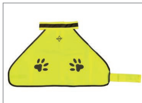
KTHG Gelb S, M, L, XL