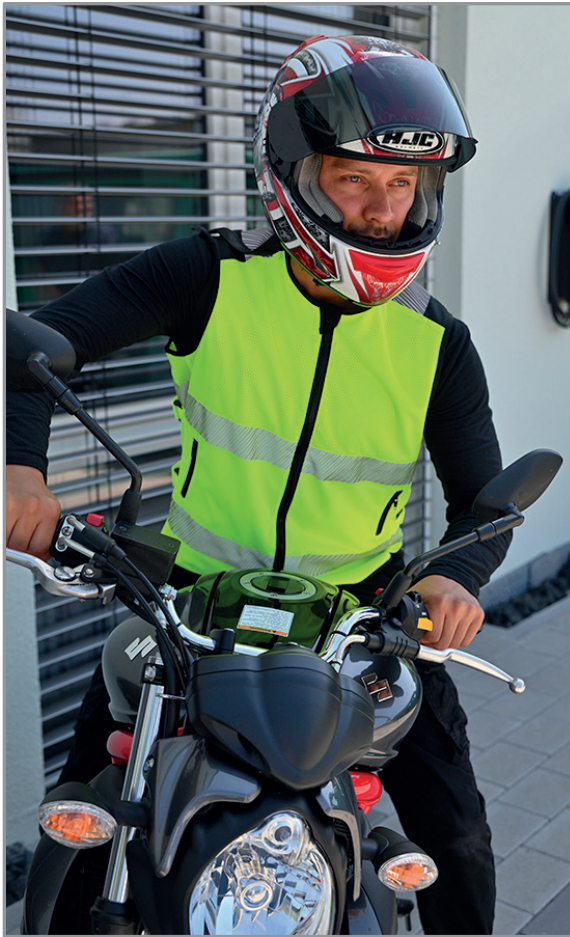
KXMMOTO - Signal Gelb Hi-Vis Mesh Warnweste - Naxos