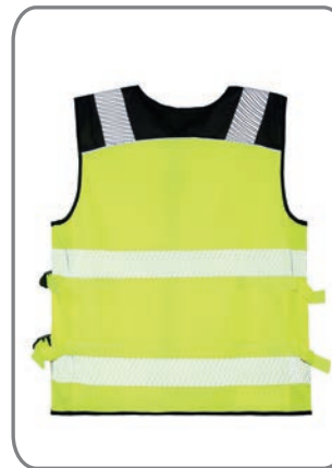
KXMMOTOYW Signal Gelb Rückseite S-7XL