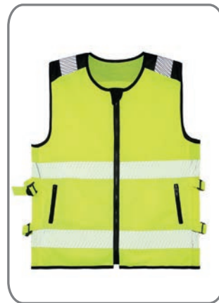
KXMMOTOYW Signal Gelb Vorderseite S-7XL