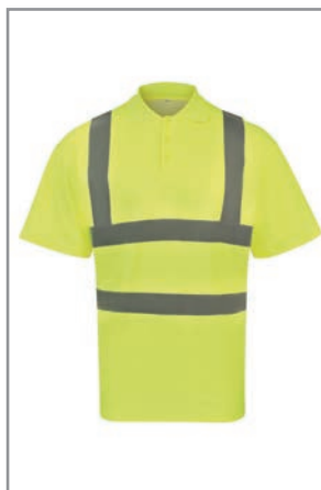
KXPCPOLOG Gelb S - 7XL

Industrie, Transport und Logistik, Brandschutz, Events, Bau, Behörden, Flughäfen, Security