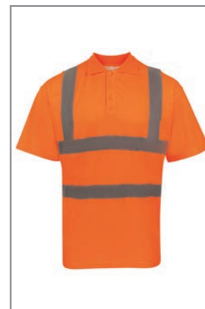
KXPCPOLOO Orange (Vorne) S - 7XL