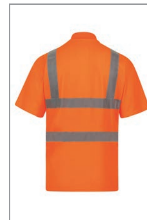
KXPCPOLOO Orange (Hinten) S - 7XL