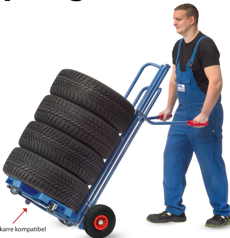
Mit Reifenkarre kompatibel