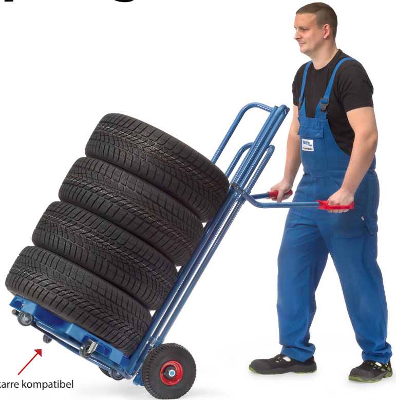
Mit Reifenkarre kompatibel