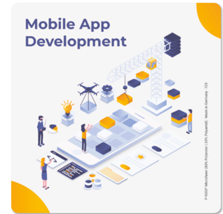
Ansicht des fertigen Displaytuchs