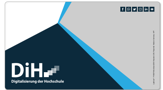
Ansicht des fertigen LapKoser®